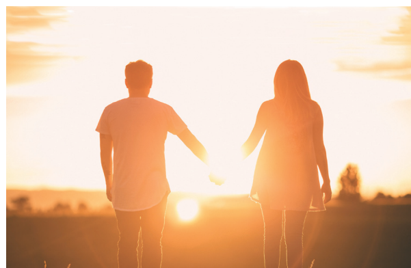
Lumière du monde