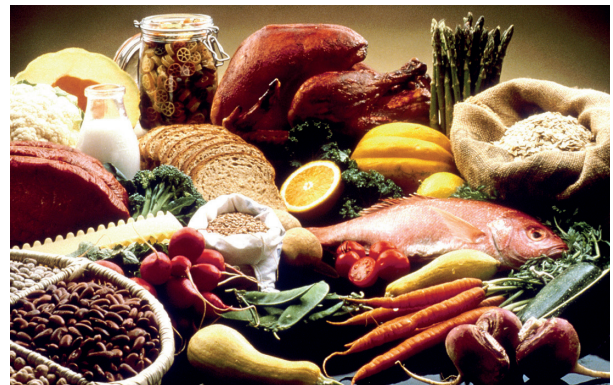
Saveurs et sensations